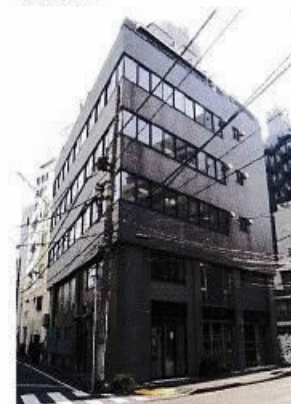
※現況を優先とさせていただきます